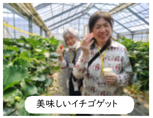
美味しいイチゴゲット

道の駅は人気です 二日目は酒蔵見学と道の駅の後で昼食でしたが、道の駅は女性には人気でした。新鮮な山菜や野菜