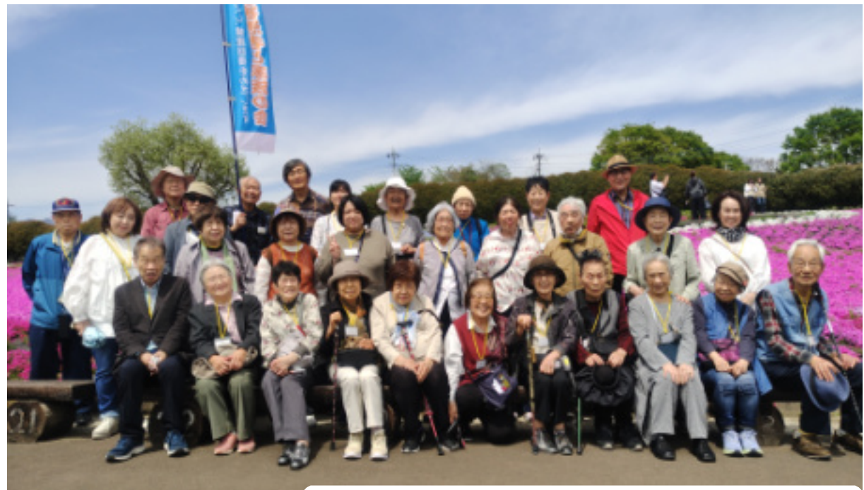
箕郷の芝桜 広大な敷地一面の芝桜は美しかった。みなで記念写真を撮りました。