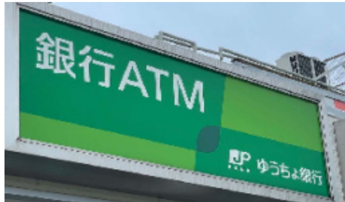
ATMでも窓口でも現金で払い込むと110円加算

窓口やATMでの現金で支払いの場合に1件ごとに料金110円が加算(払い込み人負担)になります