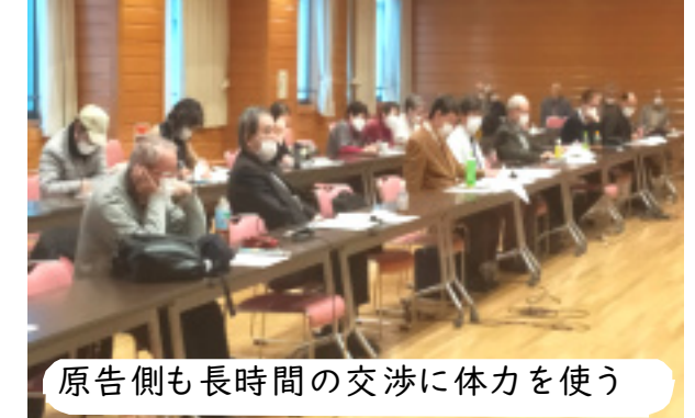
原告側も長時間の交渉に体力を使う

2007年解決した東京大気汚染公害裁判の和解により勝ち取った「和解決項の履行」についての確認です。主な議題は都内全体の道路沿道にかかわる「総括的課題」と各区の「要求」に答えるものに分けます。 自転車活用推進計画 何といっても患者会が力を入れてるのは、自転車