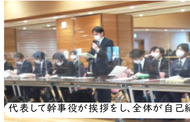
代表して幹事役が挨拶をし、全体が自己紹介

2021年12月3日12時30分、森下文化センターの会場で「第13回道路連絡会」が実施されました。被告側は、国(国交省・環境省)・警視庁・東京都から41名出席でした。私たち原告団は、全体で26名の出席でした。原告団は被告側のように補充がきかないので、原告が亡くなるばかりで年々人数が減ってしまいます。