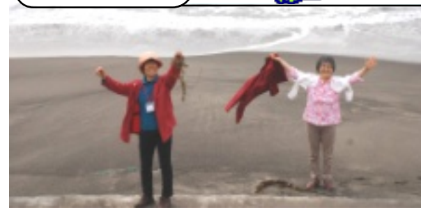
朝の散歩での光景