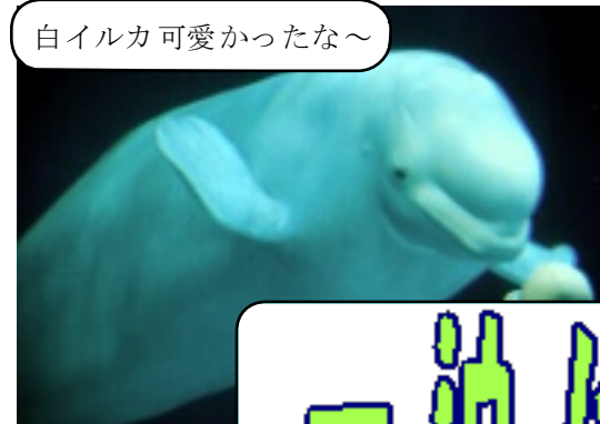
白イルカ可愛かったな～