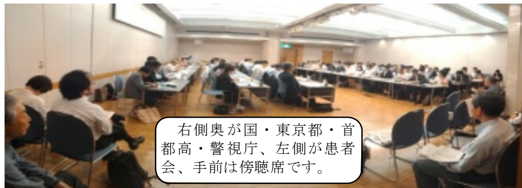
右側奥が国・東京都・首都高・警視庁、左側が患者会、手前は傍聴席です。

細切れで不十分な「自 転車走行空間推進計画」 も遅々として進まなかつ たのに、2020年の 東京オリンピックまで には、約400Kmを 達成するという。 オリンピック会場周 辺や観光地を優先して 整備するのは？ オリンピックが終わっ たら「自転車走行空間 推進計画」はお座なり にされてしまうのでは？ と、不信感を拭えませ んでした。