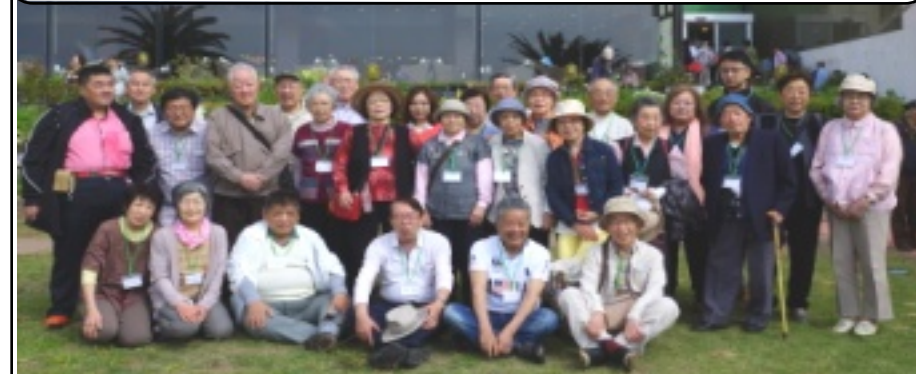
↓3号車 世田谷・太田・中野杉並・練馬・江東墨田と弁護士