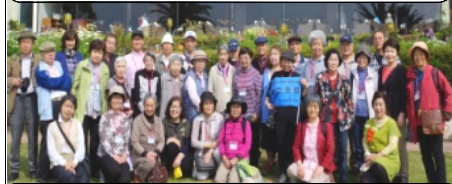
↓2号車 文京・板橋・豊島・北支部のみなさん